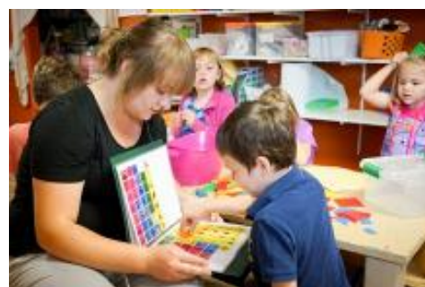
Les formulaires de mise en candidature doivent être présentés à l'ANBIC au plus tard le 18 décembre à 17 h.

Les prix sont présentés à une personne ou à une équipe qui a fait une contribution constructive et significative à l'inclusion scolaire au sein du système scolaire public de la petite enfance à la 12 e année et dans les établissements postsecondaires de sa province ou territoire en 2015. La présentation des prix s'inscrit dans les activités prévues pour le mois national de l'inclusion scolaire, en février 2016.